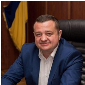
Начальник Головного територіального управління юстиції в Івано-Франківській області СТАНІЩУК Микола Васильович

Прийом громадян проводиться: з 10.00 год. до 12.00 год.